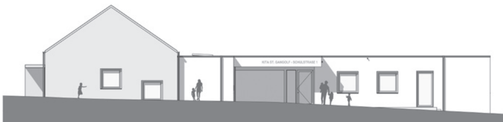
Foto (Heisler Architekten) • Bericht: Kath. Kirchengemeinde St. Gangolf Röttingen

Der Neubau wird notwendig durch die zunehmenden Bauschäden des alten Gebäudes, welches den Röttingern als „Klösterle“ bekannt ist. Eine Renovierung dieses Gebäudes wäre deutlich kostenintensiver geworden.