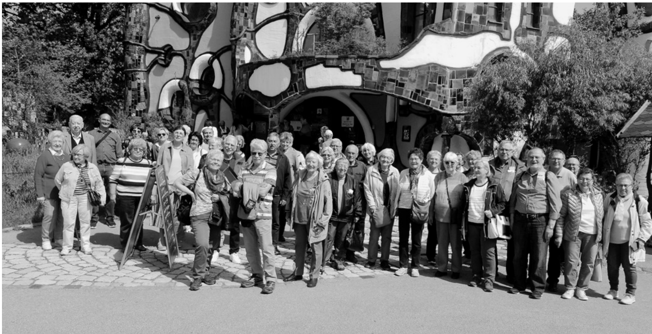
Unser Bild zeigt die Gruppe vorm Kunsthaus.

lang über Architekt Pelikan, die Idee zu verwirklichen. Über mehrere Stockwerke wird die Braukunst in Bildern aufgezeigt, Höhepunkt ist eine im Innern verspiegelte, außen vergoldete Kugel. Ergänzt wird diese architektonische Besonderheit durch das Kunsthaus – ebenfalls im Stile Hundertwassers erbaut – in dem Werke von ihm ausgestellt sind. Die außergewöhnlich beeindruckende und interessante Führung endete im Biergarten bei Weißbier und deftigem Vesper als Lohn für eine doch etwas längere Fahrstrecke.