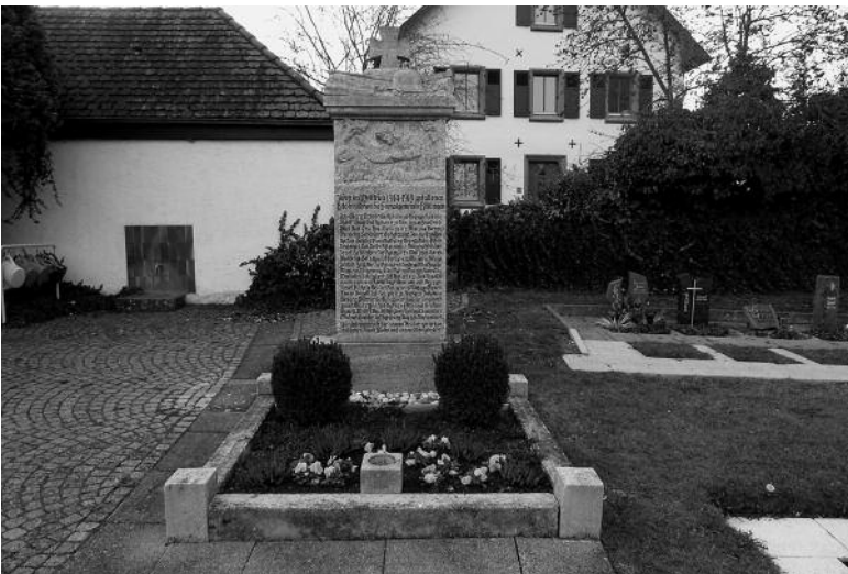
Kriegerdenkmal in Röttingen (I. Weltkrieg)

Dazu laden wir die Bevölkerung recht herzlich ein.