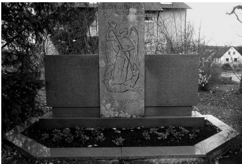
Kriegerdenkmal in Hülen (II. Weltkrieg)

Bei schlechtem Wetter findet die Totenehrung in der Kirche statt.