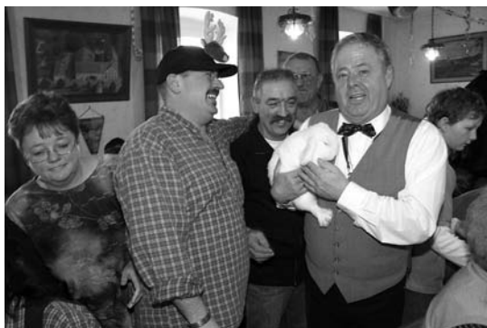
Marktgeschehen am Rosenmontag im „Goldenen Rad“