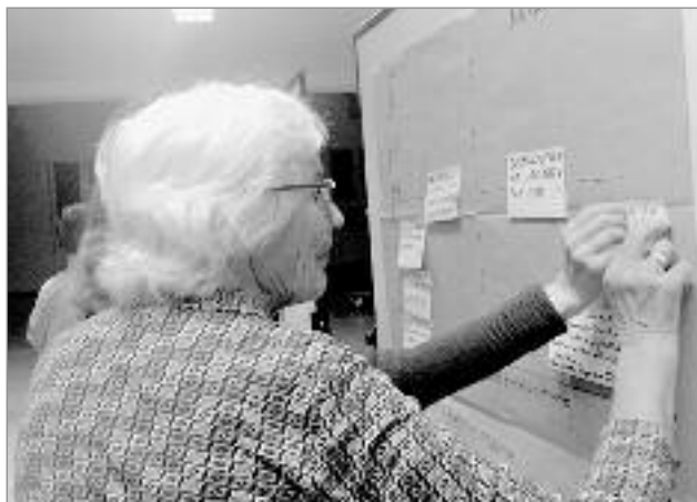
Im Oktober-Workshop waren Projektideen gesammelt und von allen Anwesenden mit Klebepunkten bewertet worden

Die zweite Projektphase bis Mai 2018 wird darauf fokussieren, einige Modellprojekte genauer auszuarbeiten: Was ist das jeweilige Ziel des Projektes und wie kann der Erfolg gemessen werden, welche Maßnahmen und Ressourcen sind nötig, wie kann der Zeitplan aussehen und welche Akteure und Partner sollten einbezogen werden?