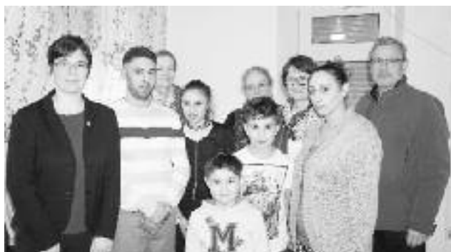
Die Flüchtlingsfamilie in der Bahnhofstraße 30