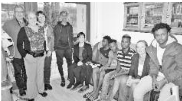
Die „UMAS“ in der Uhlandstraße 14