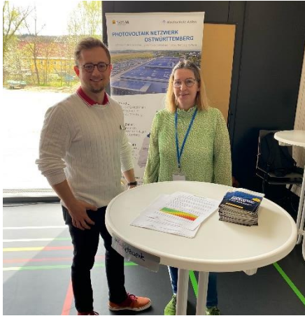
PV Netzwerk Ostwürttemberg