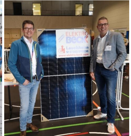
Elektro Beck GmbH