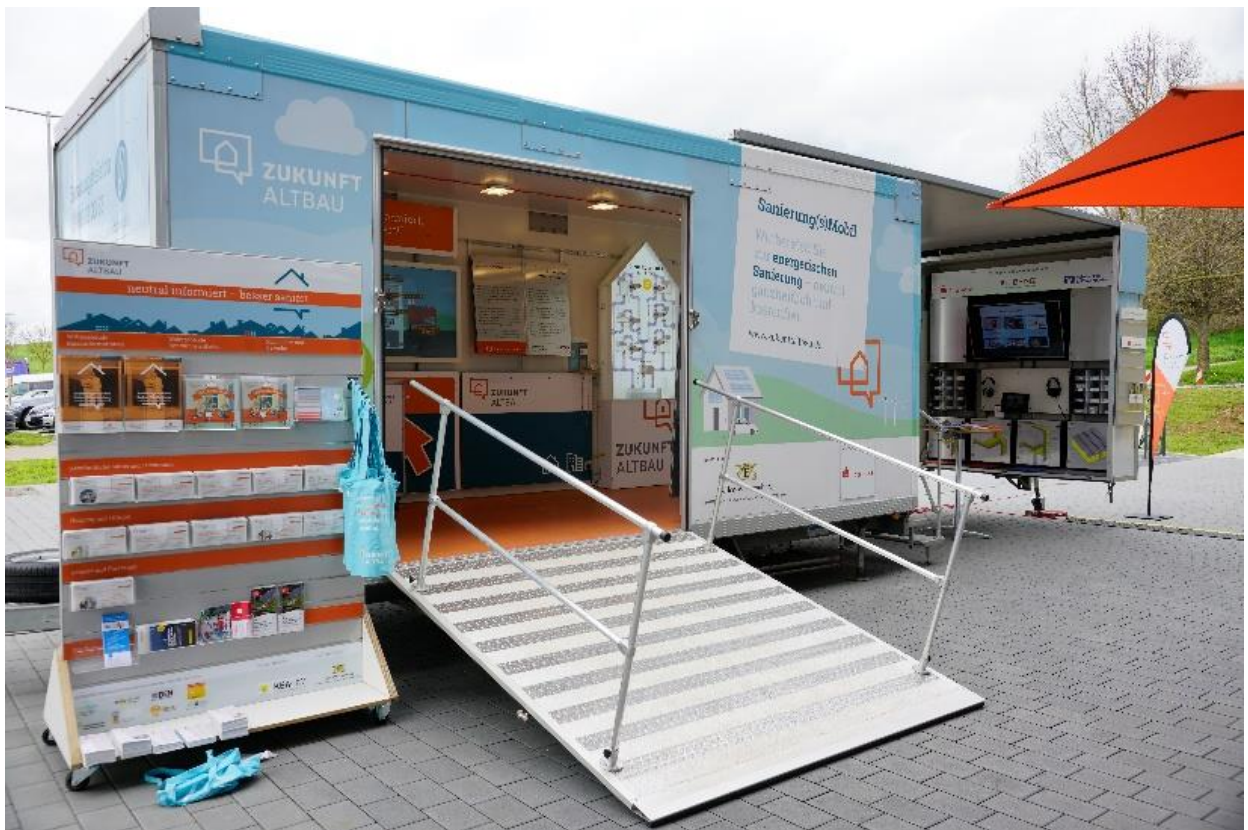
Sanierung(s)Mobil BW „Zukunft Altbau“