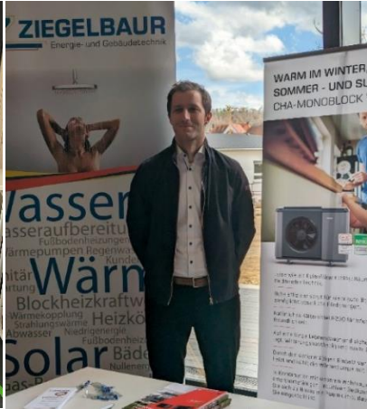
Ziegelbauer Energie- und Gebäudetechnik