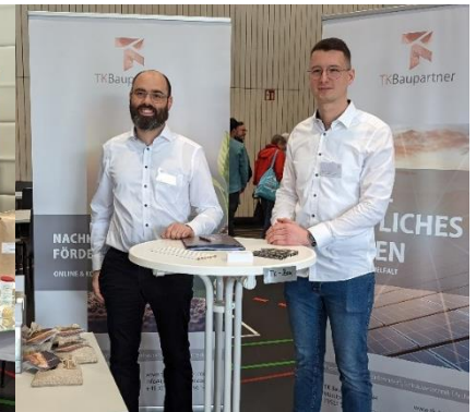
Firma TK Baupartner