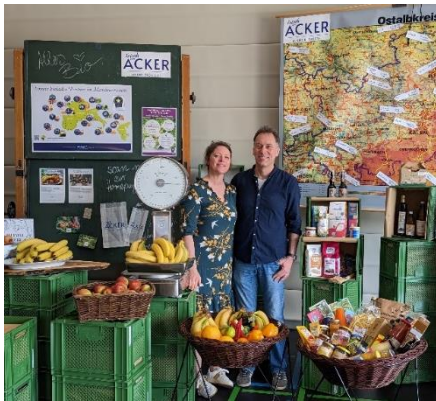
Frisch vom Acker