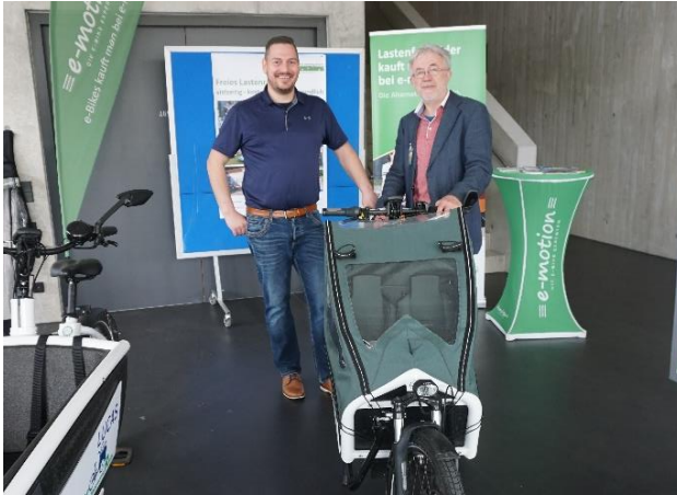
Gerätering aus Westhausen