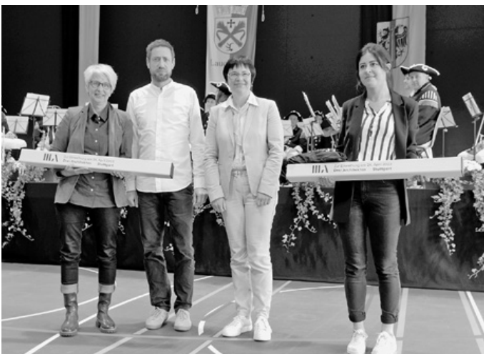
Geschenkübergabe durch das Büro Drei Architekten