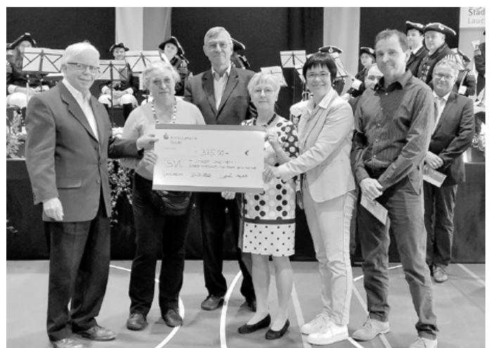
Übergabe Jubiläumsscheck an den SVL zum 75-jährigen Bestehen

Bericht und Bilder zum Tag der offenen Tür gibt es im nächsten Stadtanzeiger