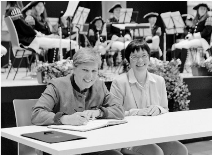
Eintrag der Ministerin in das Goldene Buch der Stadt Lauchheim