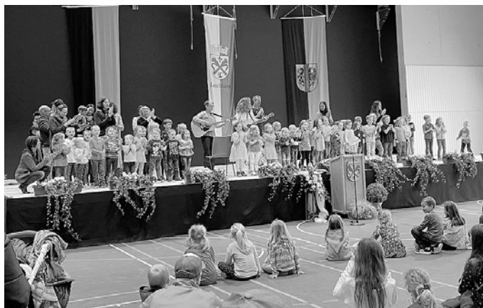
Liedbeitrag der städtischen Kindertageseinrichtungen