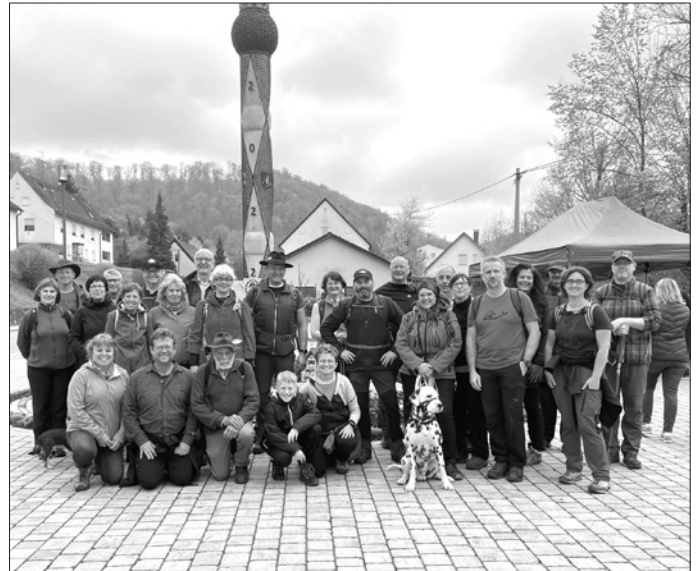
Bild: Tour 1 – sportlich aktive Tour mit insgesamt 19 Kilometer – in Aufhausen unterm Maibaum

Wir sagen „Herzlichen Dank“ für die Rundum-Betreuung am Maifeiertag.