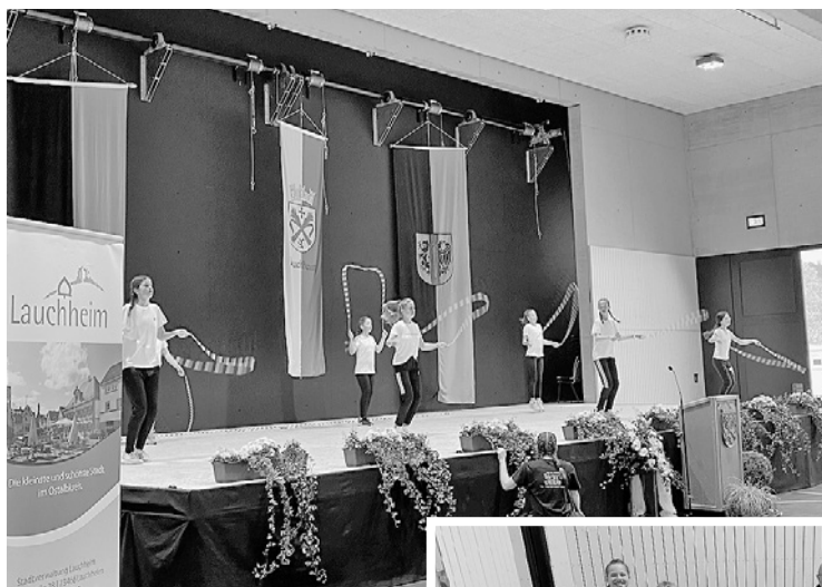
Rope Skipping SVL