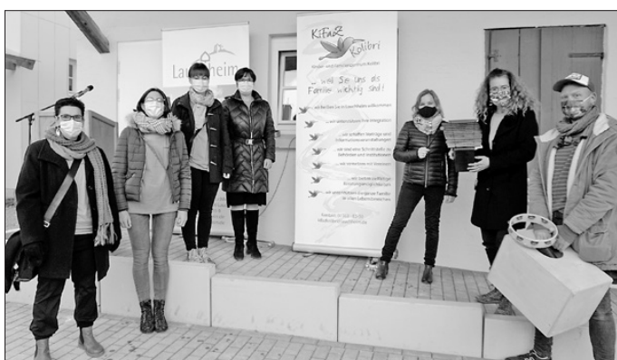
Die Bewegungskindertagesstätte Kolibri wird zum Kinder- und Familienzentrum (KIFaZ) Kolibri.